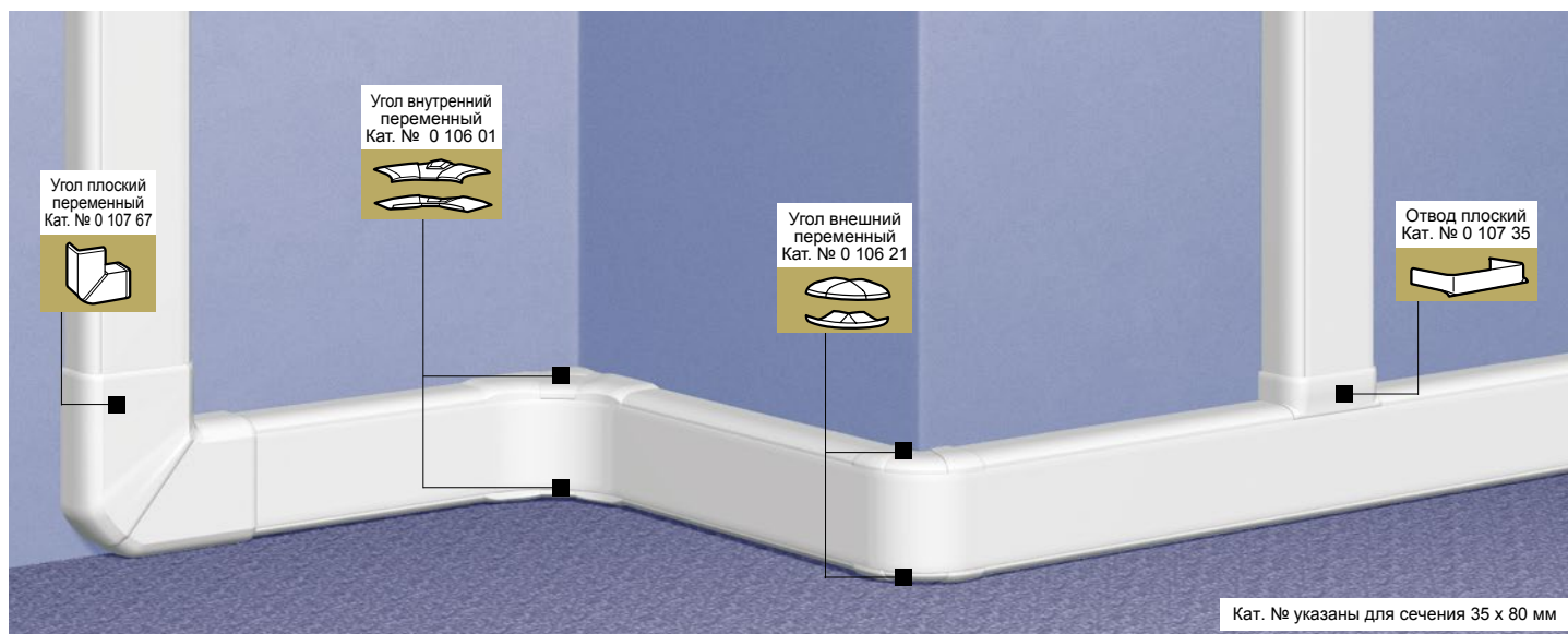
Таблица выбора стр. 708-709 Таблица ёмкости кабель-каналов стр. 707

профили, крышки, перегородки, аксессуары