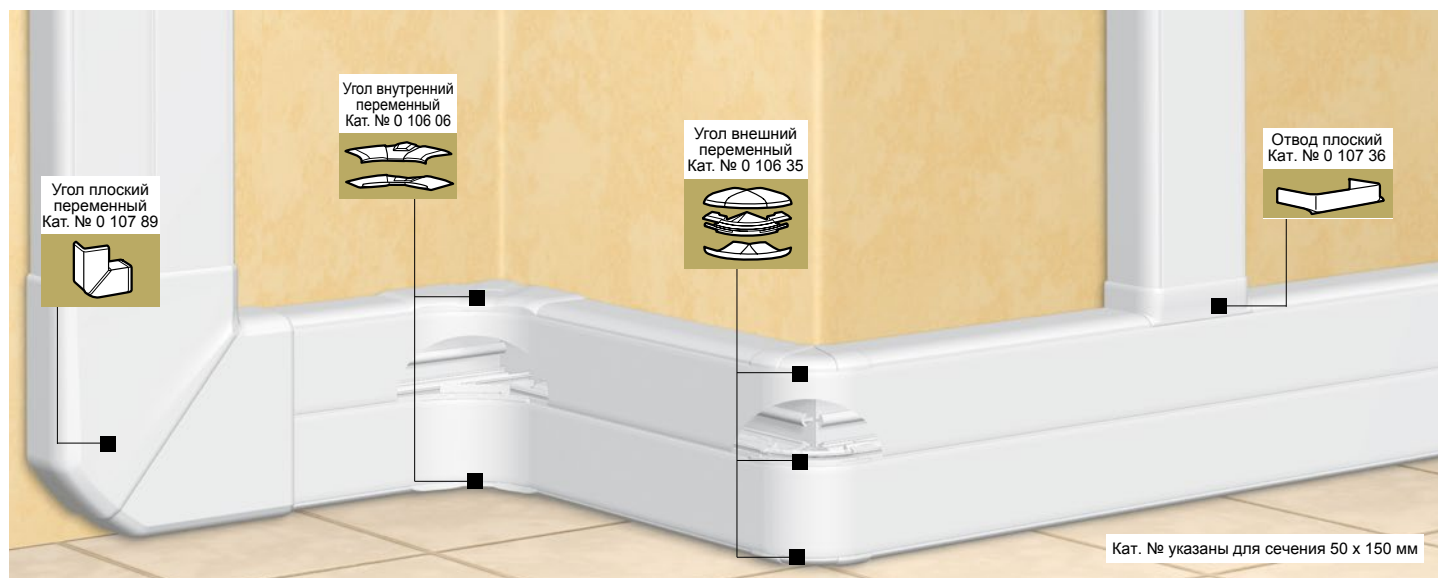
Таблица выбора стр. 708-709 Таблица емкости кабель-каналов стр. 707

комплект «профиль + крышка + несущая перегородка»