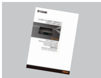
Краткое руководство по установке